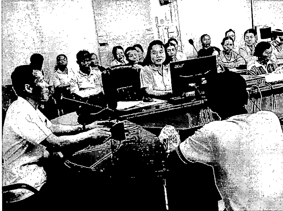
แจ้งวัตถุประสงค์ของการมาประชุมในครั้งนี้

ผู้เข้าร่วมกิจกรรมประกอบด้วย ผู้นำชุมชน ๑๕ หมู่บ้าน อสม. และประชาชน